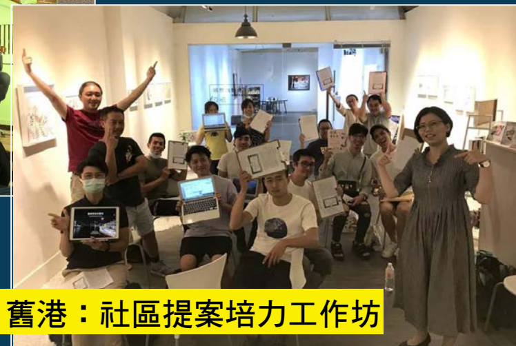
舊港：社區提案培力工作坊