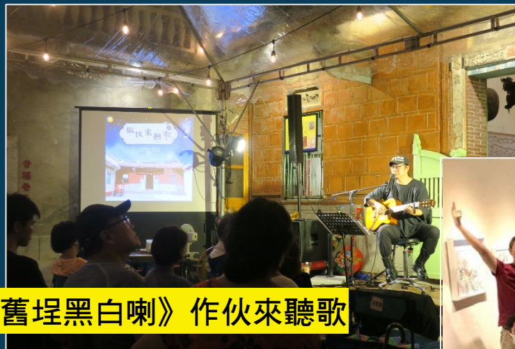
《舊埕黑白喇》作伙來聽歌