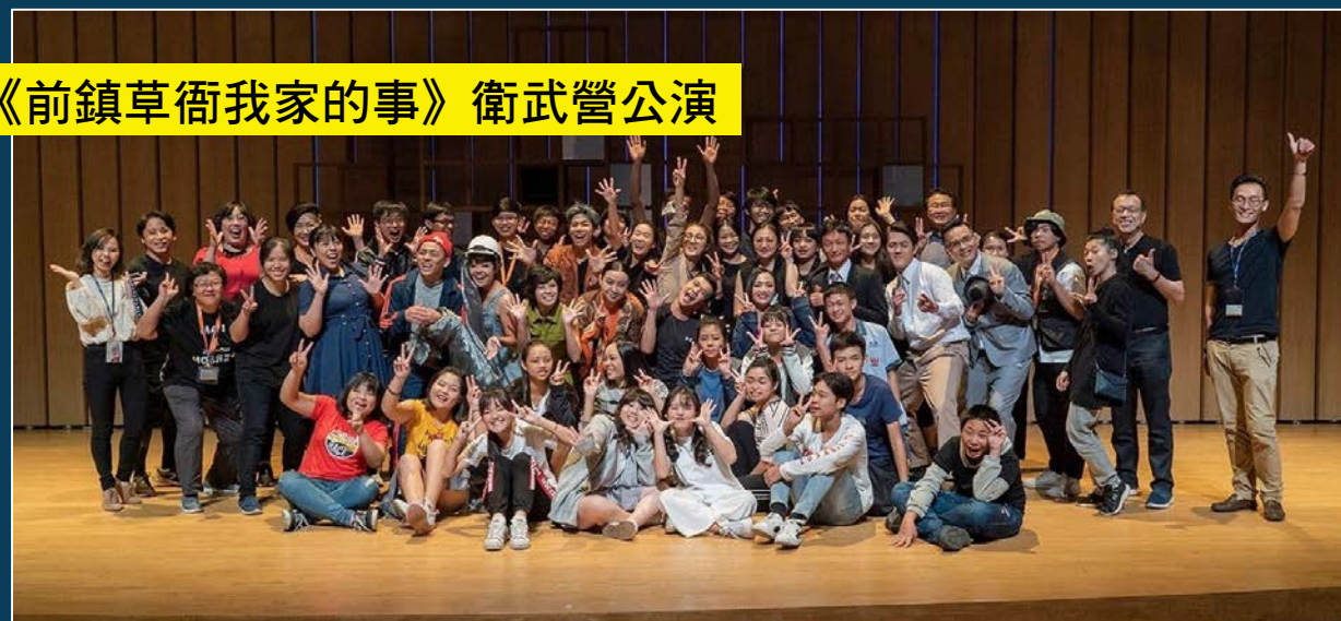
《前鎮草衙我家的事》衛武營公演